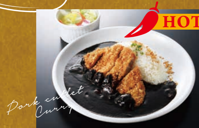
黒 ブラックカツカレー