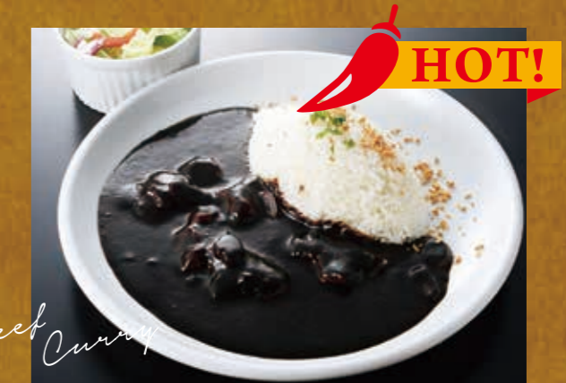
黒 ブラックビーフカレー