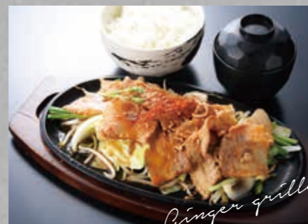
黒 豚カルビのしょうが焼き