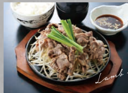
黒 ジンギスカン定食